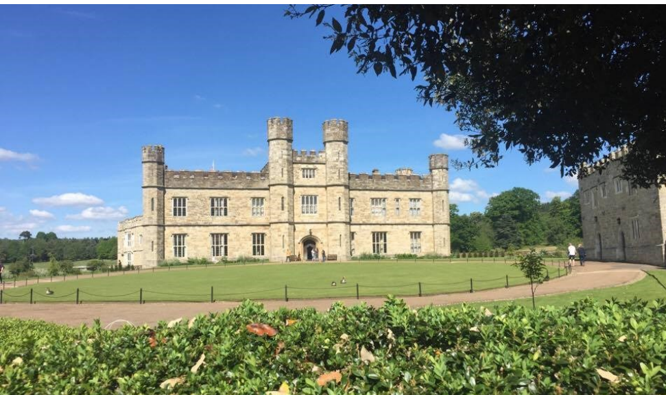
Hrad Leeds v anglickém Kentu

Pátý den následoval Chichester a město Arundel, (pokračování na straně 2)