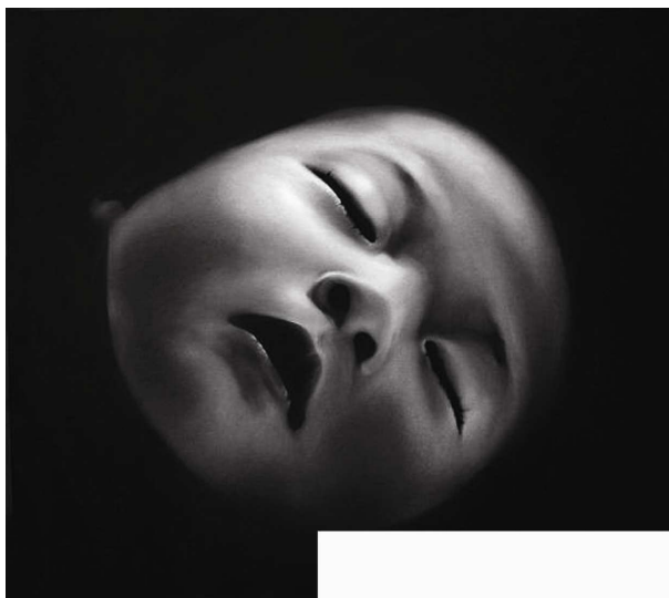
Robert Longo- Bez názvu